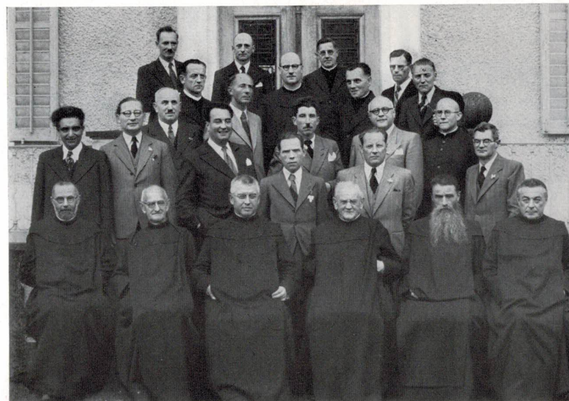
Die silbernen Jubilare mit ihren einstigen Lehrern

Trotz aller entgegenstehenden Hindernisse wurde die Jubiläumstagung doch zum vollen Erfolg. Das zeigte sich schon am Pfingstabend beim ersten Wiedersehen (bei manchem nach 25 und mehr Jahren), bei der Begrüßung im Kollegium und erst recht beim